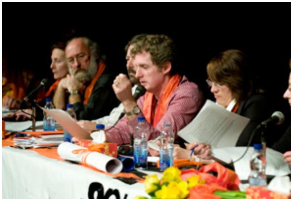
Après une nuit intensive de négociation, le comité de né- a expliqué l'entente de principe aux profs.

Montréal (SPUQ-CSN) représente 1000 membres.