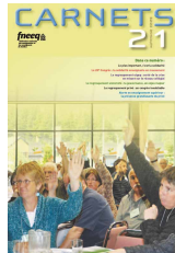
Carnets #21 Automne 2009