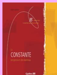
La constante progression des femmes