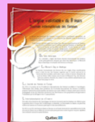
L'origine «véritable» du 8 mars