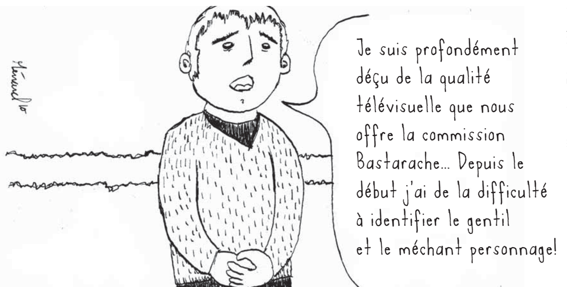
Illustration : Etienne Ménard