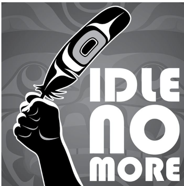
Icone du mouvement Idle No More . Hiver 2013.